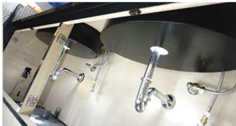
ボトムケースカバー取付例