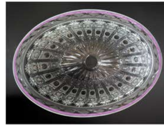
ピンク色の部分にテープをきれいに貼りつけます。