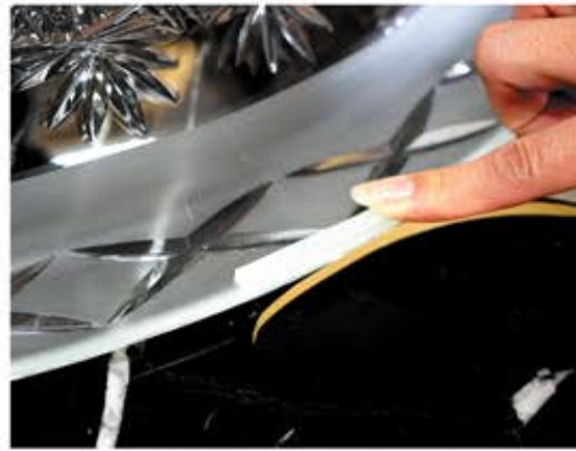
外周縁部分にコーキングテープを貼り付ける。